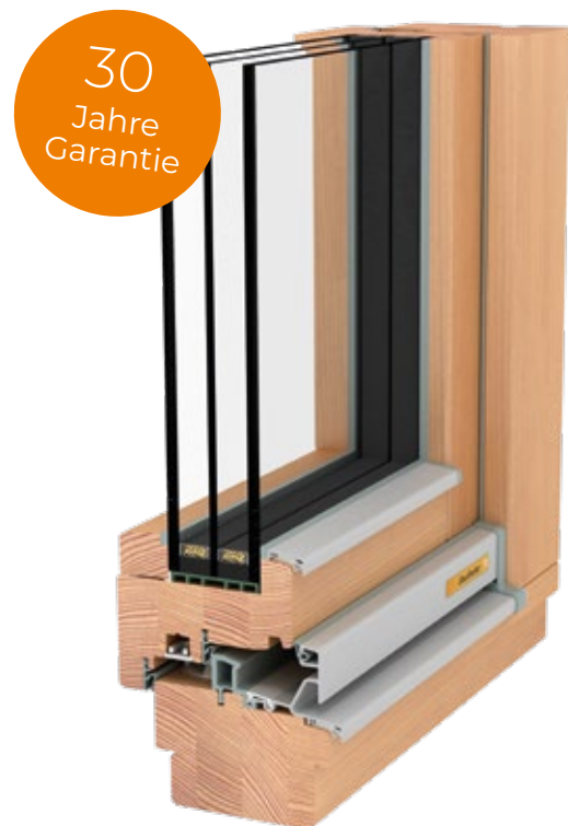
Holz NATURELINE 92